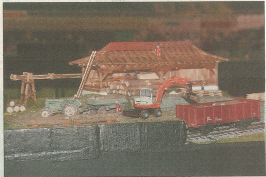
Nachgestellter Kiesbetrieb, der sogar richtig funktioniert

Alles in allem ein gelungener Event, bei dem nicht nur die Freunde von Modelleisenbahnen auf ihre Kosten kamen.