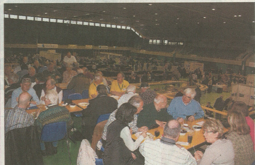
Bis auf den letzten Platz besetztes Beizli